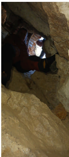
Nos amis de la surface nous rejoignent