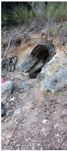
Un courant d'air frais s'engouffre dans la cavité