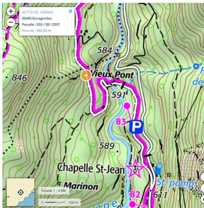
L'entrée de la cavité

Rendez-vous à 7h à la Brasserie du Sénat à St Vallier de Thiey.